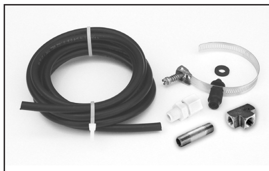
Circuit externe d'évacuation de l'air